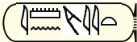
Meritamun (Merit Amun)

Neuere Deutungen sehen jedoch eine ursprünglich ägyptische Herkunft als Ableitung von mrj („geliebt“), eventuell mit dem göttlichen Subjekt Amun: merit-amun, „von Amun Geliebte“.