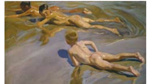
Abb.: Manneken Pis, Brüssels Wahrzeichen / Knaben am Strand (Joaquin Sorolla, 1863–1923)

Die ältere Generation durfte früher das jeweils andere Geschlecht nur als Kunstwerk (Gemälde, Plastik) sehen. Übertriebene und alberne Körperfurcht (Somatophobie) schüch-tert heute wieder Maler und Bildhauer ein. Mir wäre es recht gewesen, wenn ich als Knabe auch gefilmt usw. worden wäre, weil ich als Knabe auch gut ausfah.