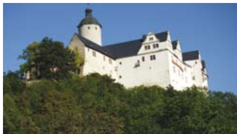
Burg Ranis: oben: Blick vom Tal hinauf; unten: Blick auf den Burghof.

Ein kurzer Ausflug bringt uns zu der kleinen Stadt Ranis, deren Burg weit in das Land blickt. Diese, als Schutz gegen die Slaven errichtet, wurde von Kaiser Heinrich IV. 1084 als Castrum Ranis erstmals ur-