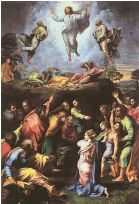
Die Verklärung Jesu (transfiguratio), Gemälde von Raffael

In diesem Bericht über die sog. Verklärung Jesu' (transfiguratio) werden also die vielen tatsächlichen oder gefälschten 'Tatsachen', die wir heute als unecht erkennen, gar nicht erwähnt. Nur ein Stimmenphänomen, das wir heute auf Tonband zc. aufnehmen können, wird hier herangezogen.