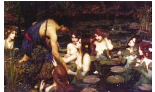
Hylas und die Nymphen (Gemälde von John William Waterhouse, 1896)

So ist also die Antike, die gar keine Aufzeichnungsmöglichkeiten hatte, von sehr hellhörigen und medial begabten Menschen auf Götter gebracht worden, welche wir heute nicht mehr kennen. Unter bestimmten Bedingungen, so wie in der Grotte der Nymphae sphrangitides, waren aber die akustischen Bedingungen so gut, daß sehr viel mehr Menschen als üblich überfönnliche Stimmen hörten. Daß das Phänomen aber nicht mehr beachtet wurde und in Vergessenheit geriet, hängt wiederum damit zusammen, daß die Kirche die Erforschung des Überfönnlichen verbot.