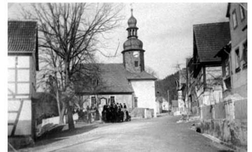
Breßwitz vor der Evakuierung Unten: Blick vom „Waldhotel am Stausee“

Unser Weg führt weiter wieder zur Saale zurück. Der in den dreißiger Jahren erbaute Saalestausee mit der Hohenwarte-Talsperre zieht viele Besucher an. Damals 1938 wurde das Dorf Breßwitz aufgegeben. Der Name, 1125 erstmals erwähnt, bedeutet ‚Birkenort‘ (von altforbisch Bresvice zu ‚breza‘ = Birke; vgl. lat. betula = Birke und vicus = Dorf). Die untenstehende Aufnahme zeigt den letzten Gottesdienst im Ort, der darauf in der Saale verschwand. Heute liegt er ca. 40 m tief unter dem Wasserspiegel der Saale.