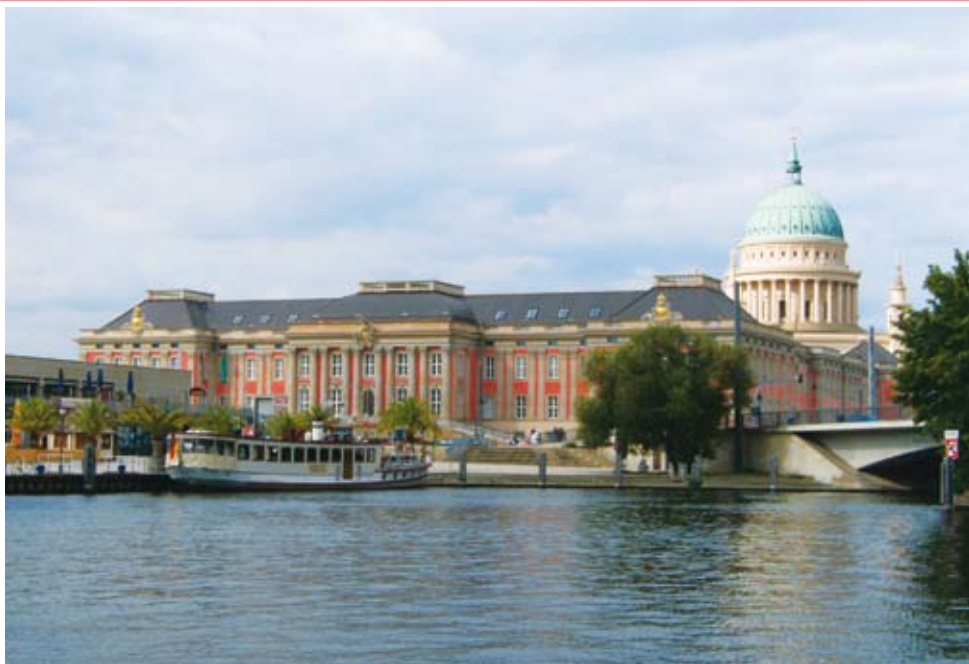
Das rekonstruierte Potsdamer Stadtschloß.

Bekenntnis zum Stadtschloß und ersten ernsthaften Planungen; konkrete Maßnahmen zu dessen Wiederaufbau erfolgten jedoch noch nicht.