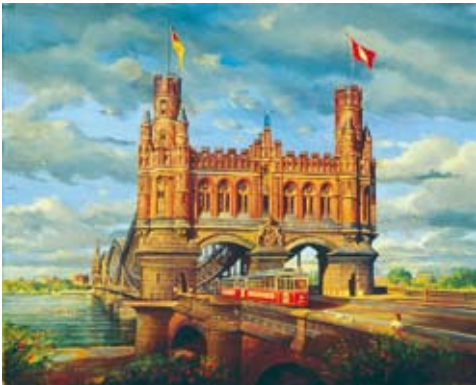
Die alte Elbbrücke mit der Linie 11 nach Harburg

Die Straßenbahn-Postkarten mit Motiven der ehemaligen Hamburger Straßenbahn nach echten Ölgemälden von Dipl.-Ing. Helzel sind zum Teil erhältlich im Kleinbahn-Museum Wohldorf. Lassen Sie sich das Museum nicht entgehen! Die gesamte Serie mit 30 schönen Postkarten ist erhältlich gegen 22,50 € + 1,50 Porto beim Herausgeber.