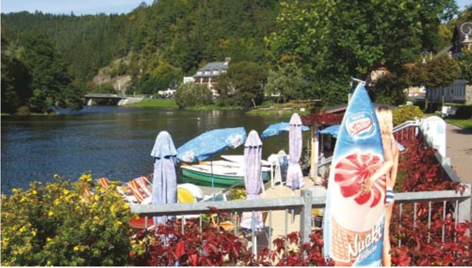
Die Saale in Ziegenrück

W ir besuchen diesmal Thüringen, und zwar besonders zwei Orte an der Saale: das Städtchen Ziegenrück sowie den großen Hohenwarte-Stausee.