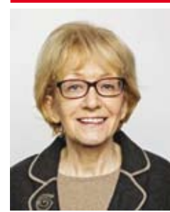
Prof. JUDr. Helena Bölková

Die neue tschechische Justizministerin Helena Bölková hat mit einem Interview mit dem liberalen Internetportal „ECHO24.cz“ zwei Fliegen mit einer Klappe erschlagen: Sie äußerte, die Tschechen hätten es im Protektorat noch relativ gut gehabt, und sie bedauert die Vertreibung der Sudetendeutschen. Beides darf man in Tschechien nicht gerne sagen!